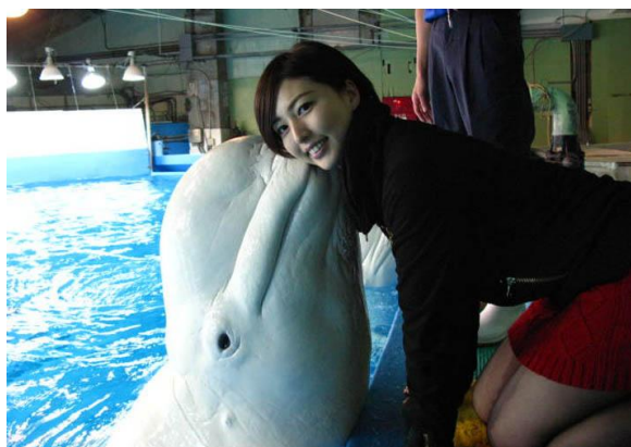
ベルーガのキスプレゼントでにっこり