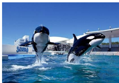
豪快なシャチパフォーマンス