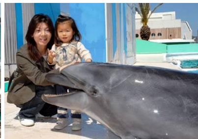
動物とのふれあい体験「イルカにタッチ」