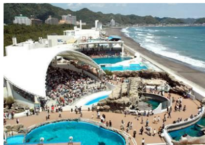
鴨川シーワールド 園内俯瞰