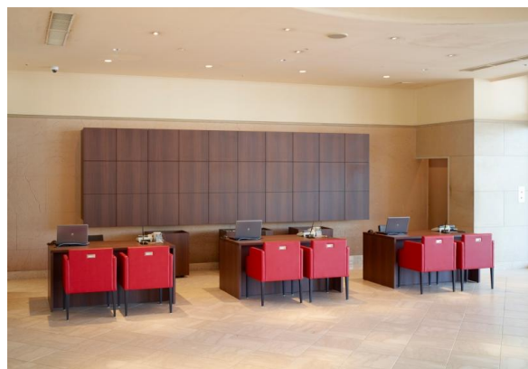
リニューアルしたフロント・ロビー

和歌山県南紀白浜で随一のロケーションを誇るオーシャンビューと、日本三古湯の白浜温泉、2004年に世界遺産に登録された熊野古道など雄大な自然と風土に触れながら、心づくしのおもてなしの中で、思い出に残るかけがえのないひとときをお過ごしください。