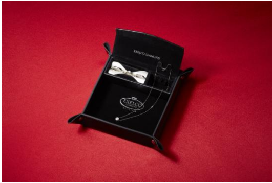
▲EXELCO オリジナルジュエリートレイ&ボックス