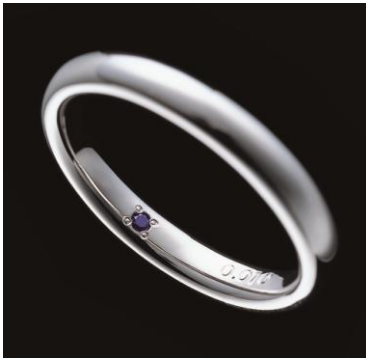
▲シークレットストーン

期間中、エンゲージリング・マリッジリング同時ご成約いただいた方全員に、「EXELCO オリジナルジュエリートレイ&ボックス」をプレゼントいたします。 また、プロポーズの演出を引き立てるエクセルコのローズボックスを、通常¥10,000(税抜)のところ¥5,000(税抜)で販売いたします。 ※無くなり次第終了