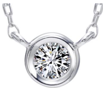
▲プリュミエールエクラ 表

エクセルコダイヤモンドは、一生に一度のブライダルジュエリーをメインに扱うブランドとして、厳選されたダイヤモンド原石の買い付け、通常の 4 倍の過程をかけ行う研磨といった「こだわり」によって、輝きを重視したダイヤモンドを生み出し続けてきました。ダイヤモンドにこだわってきたエクセルコが、ファッションジュエリーに展開することで、美しい輝きをより身近に実感することができます。