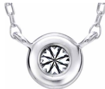
▲プリュミエールエクラ 裏 フクリンタイプだからこそ見える ハートマークが、エクセルコの ダイヤモンドの質の高さを表して います。