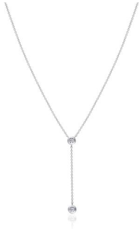
▲ネックレス K18WG Dia2.5mm×2P チェーン全長 47cm