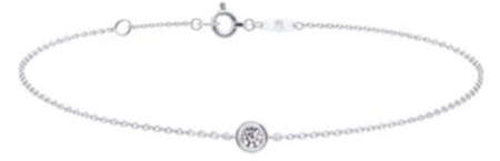
▲ブレスレット K18WG Dia2.5mm×1P