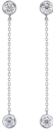
▲ピアス / イヤリング K18WG Dia2.5mm×4P