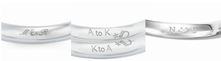
▲七夕限定オリジナル刻印:左「Moon star」中央「Wishing star」右「Star smile」