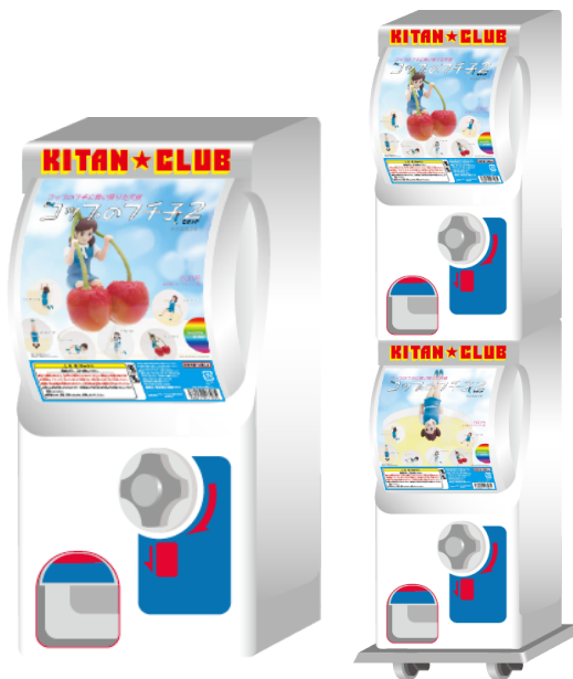
▲カプセル自動販売機イメージ