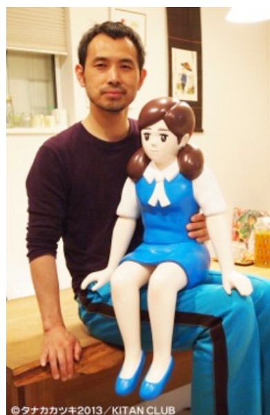
▲窓辺のフチ子サンプル