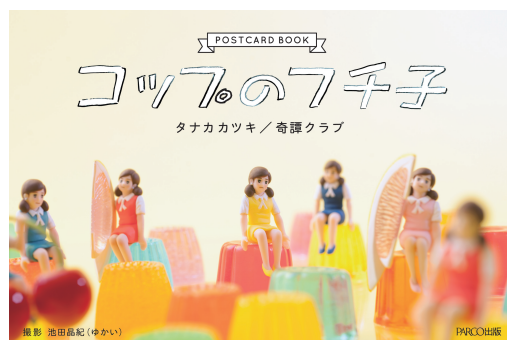
▲ポストカードブック