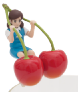
▲さくらんぼフチ子