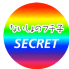
▲ないしょのフチ子