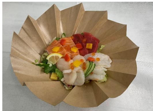
「ドレッシングで食べるサラダ刺身」