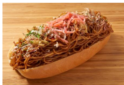
焼きそばたっぷりドッグ