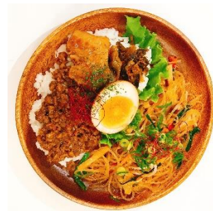
「アジア弁当セット」 ルーローファン&チャプチュエ