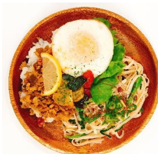
「アジア弁当セット」 スパイシーガパオライス&パッタイ