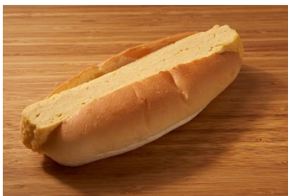
だし巻ドッグ（海老江ドッグ）