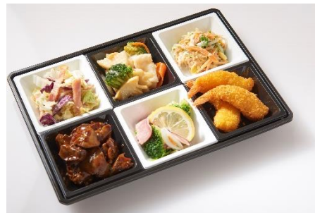
「バルセット」 総菜6品