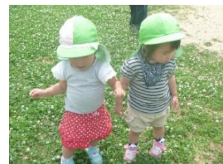
海東ひばりベビーセンター

地域の共働きの家庭をしっかりとサポートするため、小規模保育の「海東ひばりベビーセンター」や、ダンスや英会話、プログラミングなど毎日通いたくなるスクールがある、キッズ教育「森のキッズeクラブ」と幼児教育「講談社こども教室」が出店します。