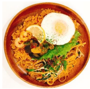
「アジア弁当セット」 ナシゴレン&シンガポールビーフン