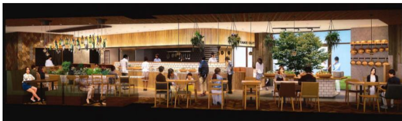
森のサーカス ～cafe & family restaurant～

ママ友やファミリーでくつろげるカフェ&レストラン「森のサーカス ～cafe & family restaurant～」やカジュアルな「肉中華バル WOK」、スペイン料理の「ファミリアピンチョス テララ」を展開します。