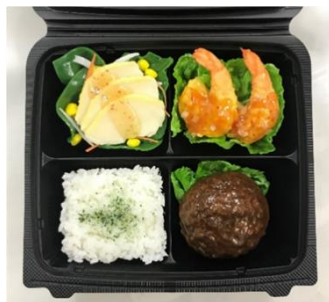
「選べるお弁当」 3種類の総菜と白ごはん