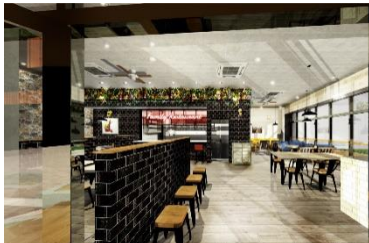
THE MANHATTAN GARDEN

「類農園直売所」では、生産者さんから直送される地産地消の新鮮オーガニック野菜やこだわり食材をお楽しみいただけます。