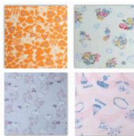
<マリッカ・バラデ4柄>

また、テキスタイルデザイナーチーム「マリッカ・バラデ」とのコラボレーションは昨年に引き続き実施し、ネコやチェリーなど女性に人気のモチーフを中心に新デザインで4柄を取り揃えました。