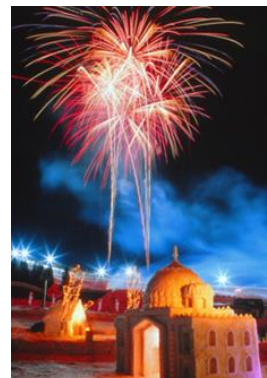
田沢湖高原雪まつり風景

当事業では、2月に開催される「田沢湖高原雪まつり」への婚活ツアーで最大の成果を目指すべく、事前の地元および首都圏での一連のプログラムで、地元への理解を深めてもらうと共に、興味を喚起してまいります。まずは、先行チームとして、仙北市の自治体職員、商工会議所青年部、農協、観光協会などから、町おこしに興味のある有志男性が集まり、仙北市の未来、さらには自分たちのことや仕事の未来について考え、女性へのPRコンテンツを制作します。その他、地元でのライフデザイン講座や独身女性を対象にした首都圏でのPRイベントなどの交流の場を提供してまいります。