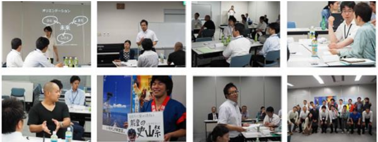
石川県・奥能登でのワークショップ風景

地方の少子化対策を「ライフデザイン」により効果を高めるプロジェクト 自分たちの町の未来、自分の人生、そして自分たちの仕事の未来に目を向けて 都市から地方への流れをつくる好事例化をめざします。