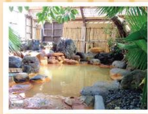
*写真は全てイメージです

旅行実施日 2015年11月14日(土)～15日(日) 募集人数 女性限定・20名(最少催行人員:12名)参加者多数の場合は抽選となります。