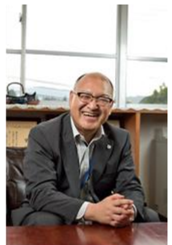
笑顔が素敵な仙北市の門脇市長