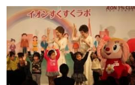
イオン すくすくラボ

* 活動の詳細な内容はこちら ( https://www.aeon.info/1p/ ) をご覧ください。