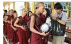
ミャンマーで托鉢体験