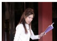
イオン ふるさと発見伝