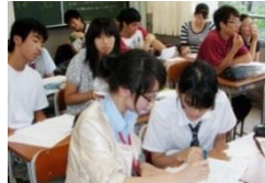
中国での授業体験