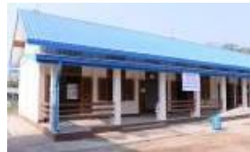
ミャンマー新校舎