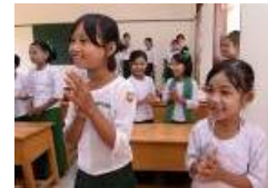
新校舎に喜ぶ子どもたち