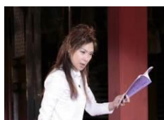
イオン ふるさと発信伝