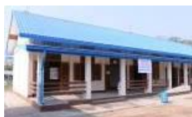
ミャンマー新校舎