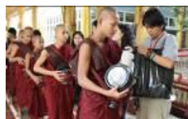
ミャンマーで托鉢体験