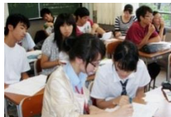
中国での授業体験