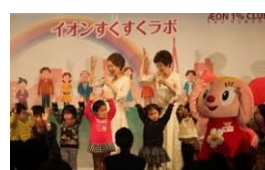
イオン すくすくラボ

* 活動の詳細な内容はこちら ( https://www.aeon.info/lp/ ) をご覧ください。