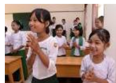
新校舎に喜ぶ子どもたち