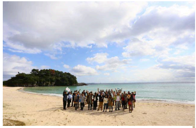
「ミライカレッジ」ツアーの様子(長崎県壱岐市)