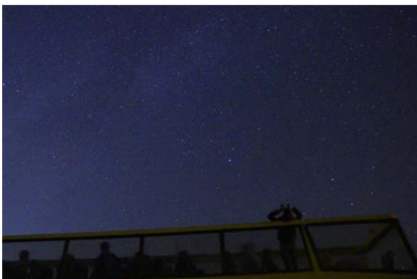
星空ツアー (イメージ)