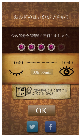
起きたら目覚めの気分を評価＋王様占い