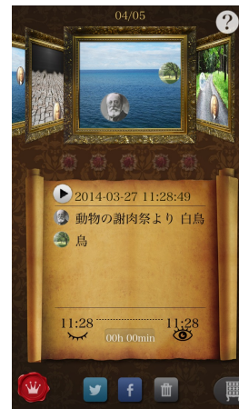
過去に作成した音も保存されています