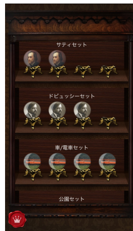
音源追加購入の画面

そして今、iPhone を持つ王様（あなた）は、好きな音を自由に組み合わせて聞きながら眠りにつくことができるようになりました。王様の寝室からは、波の音や鳥の鳴き声が入り、楽団の演奏に溶け込み、気持ち良い睡眠を促してくれるのです。