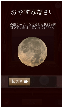
寝ている時の画面