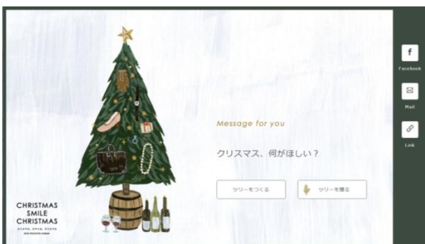
カードはメールやFacebookなどで送ることが可能。