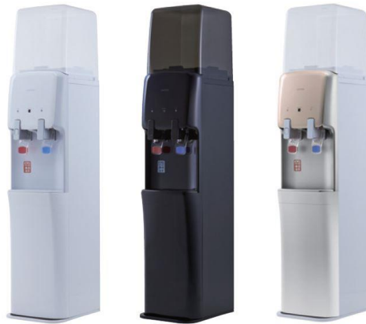
クリティアスリムサーバー II 「HC14D1L-WD-WB」 ホワイト/ブラック/シルキーゴールド