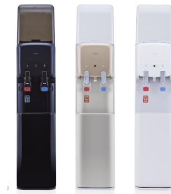
ブラック/シルキーゴールド/ホワイト

ホワイト、ブラック、シルキーゴールドの3色を用意しました。シンプルなデザインが引き立つホワイトは、清潔感のあるライトグレーとのツートンカラーを採用。都会的で洗練されたブラックは、艶やかさをまとい一層高級感を醸し出しています。オフィスや書斎にもマッチします。華やかな中にも上品で落ち着いた色合いのシルキーゴールドは、リビングだけではなく寝室やパーソナルスペースでも主張しない佇まいを実現します。