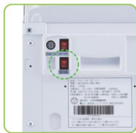
ECOモードスイッチ (背面)