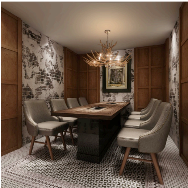
8 名様個室(個室料 5000 円/部屋)

テラス付き個室など、タイプの異なるお部屋を KINTAN 最大となる 5 部屋ご用意しています。2 名様から最大 8 名様まで、ゆったりとした空間でくつろぎながら、会食やデート、接待などお客様のニーズに合わせてご利用いただけます。1階は個室専用フロア。隠れ家的な雰囲気、他のお客様からの視線を気にすること無く、リッチな焼肉体験を心ゆくまでお楽しみいただけます。2階は麻布十番限定の「テラス付き個室」をご用意しております。乾杯のシャンパンはテラスでゴージャスに。サプライズにもピッタリのお部屋です。グリーンと外からの光を楽しみながら、極上の空間で焼肉をご堪能いただけます。