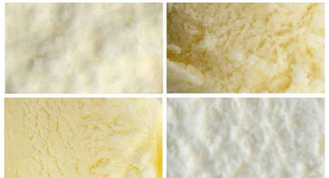
[正解]左上から時計回りに「モナ王」「爽」「雪見だいふく」「レディーボーデン」

「え、すごい！」とご自身の正解に驚きつつも、「何回も食べているので色味だけ迷いましたが、絶対これだと思いました！」とコメントし、“プロ並み”の審美眼を披露しました。