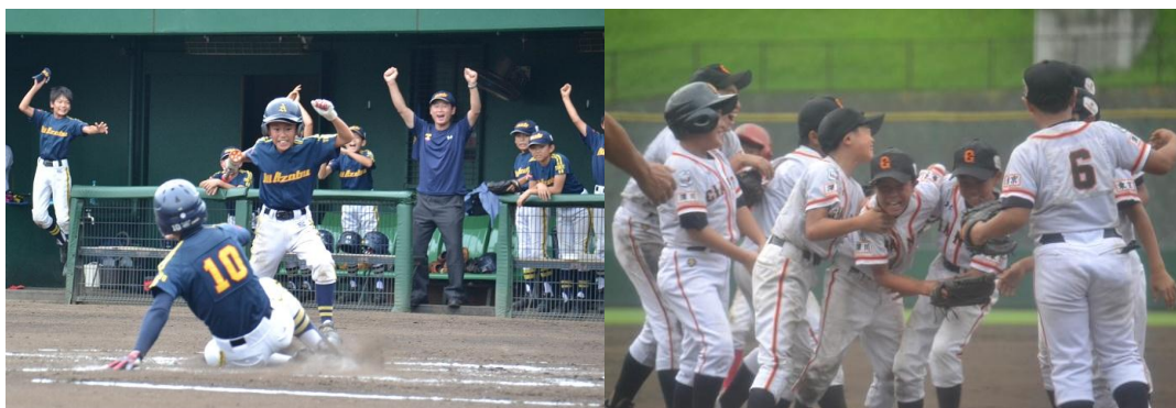
チャンピオン大会決勝に勝ち進んだオール麻布と深川ジャイアンツ