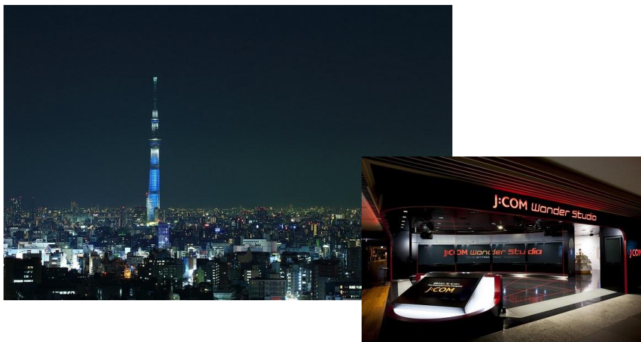
▲東京スカイツリー®(左)と 会場となる「J:COM Wonder Studio」(右)