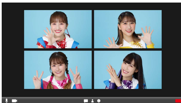
オンライン交流会イメージ

今回のキャンペーンでは、わるい虫やウイルスから身を守る「バリアポーズ」を全国の子どもたちから大募集します。応募は、バリアフレームを使って撮影した子どもの「バリアポーズ」写真を、SNSアカウント（フマキラー公式Twitterまたはキャンペーン専用Instagram）をフォローした上で、「#バリバリのバリア選手権」のハッシュタグと一緒に投稿するだけで完了。ご応募いただいた方の中から、 5名様をももいろクローバーZとの会話を楽しめるオンライン交流イベントにご招待 （保護者の方ご協力のもと、親子でご参加いただける方が対象となります）。さらに 25名様分の投稿を、「朝日新聞」の新聞広告として掲載 します。ももクロメンバーのおしゃべりや、全国紙への掲載という、貴重なチャンスをお見逃しなく！（オンラインイベント招待と全国紙掲載は別賞品となります。当選賞品はお選びいただけません）