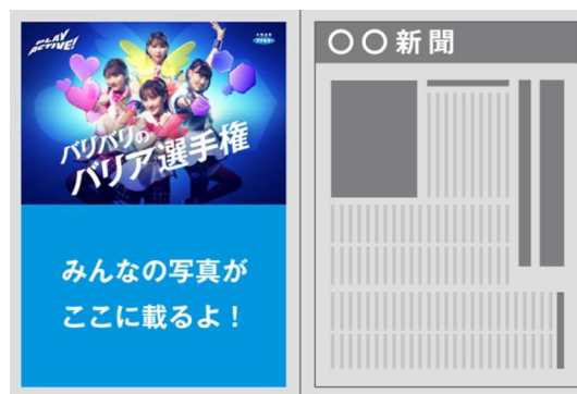
新聞掲載イメージ