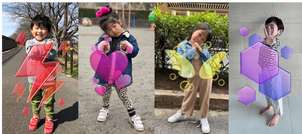
完成写真イメージ