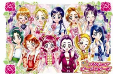
(イラスト)映画来場者特典データカードダス限定カード