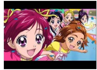
(左)「Yes！プリキュア5GoGo！お菓子の国のハッピーバースディ♪」 (右)「ちょ～短編 プリキュアオールスターズ GoGo ドリームライブ！」