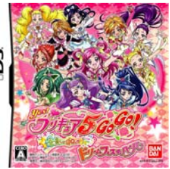
(写真)ニンテンドーDS用ソフト「Yes！プリキュア5GoGo！全員しゅーGo！ドリームフェスティバル」

プリキュアオールスターズがニンテンドーDSにも登場します。2008年10月30日に発売を予定しているニンテンドーDS用ソフト「Yes！プリキュア5GoGo！全員しゅーGo！ドリームフェスティバル」は、「プリキュア」シリーズの主人公たちが夢の競演を果たし、「プリキュア」ゲームシリーズ最大規模のボリュームをお楽しみいただける内容となっています。