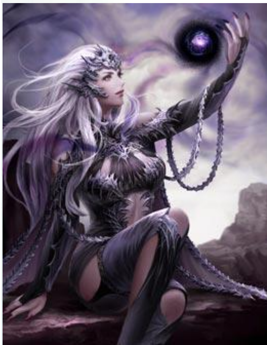
「ブロークンティア司祭」

「カムバックキャンペーン」の対象の方に Lv.80 のゴールド SSS ランクカード「ブロークンティア司祭」「フレイズの希望」の 2 枚をプレゼントいたします。Lv.80 と高レベルなのですぐに利用しても強いカードとなりますが、ゲーム内の「進化」システムを使って組み合わせれば、1 枚の強力な Epic カードに進化させることも可能です！