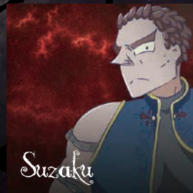
【スーザク】 四天王 四天王のリーダー的存在。武士道に惚れ込んでいて忠義に熱い激情家。