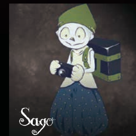
【サゴ】 一いたずら3人組 人の秘密を暴くなどパパラッチ系のいたずらが大好き。でもかわいい。