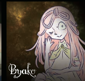
【ビャコ】 四天王 猫のように体が柔らかい女の子。恐怖の口癖が「ねえ、あそぼ〜」