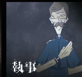
【執事】 名前は無い。キャッスルモンスターに長年使えている。臆病でビビリ屋。