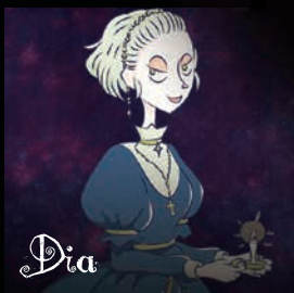
【ディーア】 恐ろしい絶世の美女。キャッスルモンスターに一目惚れし悪魔界に堕ちた。