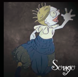
【ソング】 一いたずら3人組 何でも分解しちゃう。被害にあっていない者はいない。でもかわいい。