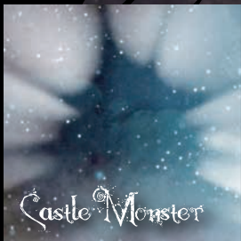
【キャッスルモンスター】 数年前、悪魔界を支配した一族の長。一族の中心人物。本当の名前がある。