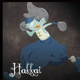
【ハツカイ】 一いたずら3人組 落書きが大好き。ビャコの顔にも落書きしちゃう。でもかわいい。