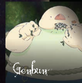
【ゲンブン】 四天王 人間をも喰らう大食漢。メタボを気にして今は薬草で我慢している。