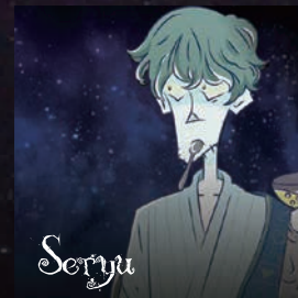
【セーリュ】 四天王 影の実力者。かんざらしが好きなスイーツ男子。禍々しい過去を持つ。