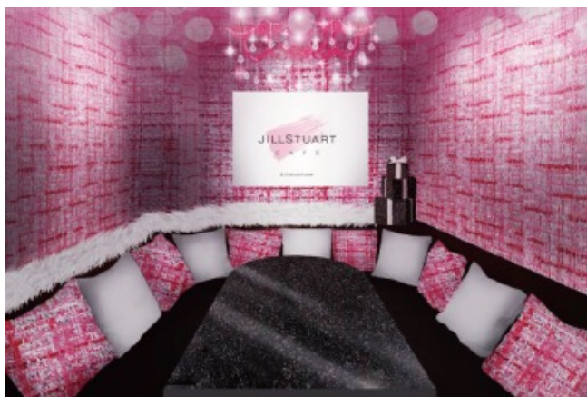
2F VIP ROOM