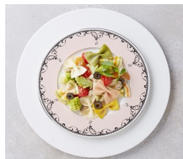
シーフードのリボンパスタ 1,400円