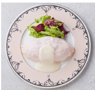
オムライス インピンク 1,000円