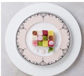
6種類の美容成分たっぷり ビューティ キューブ 680円