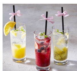
フルーツ イン ソーダ 450円