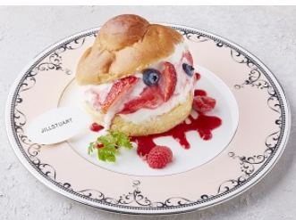
プリティベリーのプリジェラ 620円