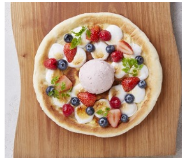
たっぷりベリーとマシュマロのピッツア 1,000円