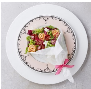
たっぷり野菜の美容ブーケ！ ビューティ ブーケ サラダ 780円 ※週替わりで3種予定。 写真はビューティブーケサラダ

「JILL STUART CAFE」の期間限定オリジナルメニュー。前菜からメイン、スイーツ、ドリンクまでかわいいだけでなく、美容によいといわれる食材を使って味もGOOD。ビューティブーケ サラダは、抗酸化効果が高いと言われるケールやビーツ、サーモンを使用しており、見た目にも美しいサラダです。ブーケ サラダは、週替わりで新しいメニューを予定。また、お得なLUNCH セットやDINNER セットもご用意しております。そのほか、関西初上陸のスイーツ、「プリジェラ」のJILL STUARTオリジナルバージョンも揃えております。