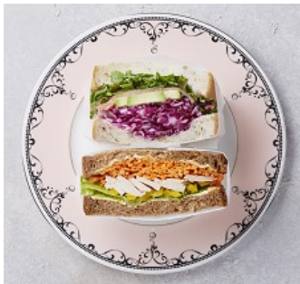
ポリウムサンドウィッチ 1,000円