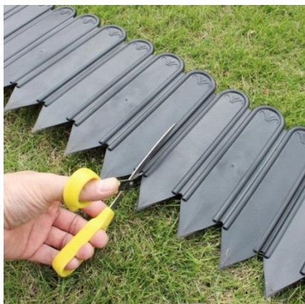
ハサミで簡単にカットが可能

本製品の特徴の一つが、ご希望の花壇のサイズに合わせてサイズを変えられる点です。長すぎたり余ったりした場合はハサミで簡単にカットでき、短い場合は付属の連結用パーツを使用することで製品同士を接合することもできます。