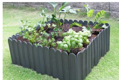
打ち込むだけでレイズドベッドも作れる