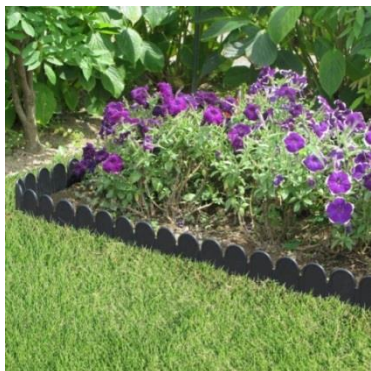
直線でも曲線でも自由自在に花壇が作れます

ゴムハンマーなどで地面に打ち込むだけで簡単に土と芝を区別できます。弾力のある素材を利用した一体型のシートで、直線でも曲線でも自由に変形させることができます。また、サイズは高さ 15cm の M サイズと 22cm の L サイズがあり、L サイズなら床面を高くした花壇（レイズドベッド）として楽しむこともできます。