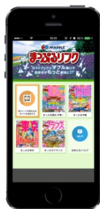
＜「まっぷるマガジン」と「まっぷるリンク」＞