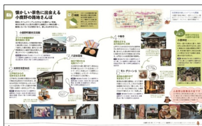
<抜粋版紹介ページ例>