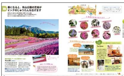
<「羊山公園」紹介ページ>

旅の楽しみといえばおみやげ探し。老舗の和菓子店が多く残るちちぶでは誰もが喜ぶ菓子が豊富に並び、伝統工芸も盛ん。秩父銘仙をはじめ、手仕事から生まれる温もりの感じられるアイテムが揃います。