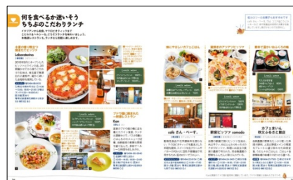
<「こだわりランチ」紹介ページ>