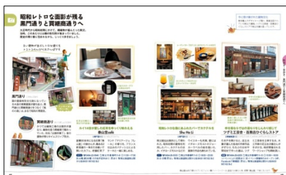
<「昭和レトロな通り」紹介ページ>