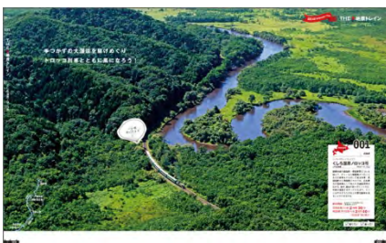
<絶景トロッコ列車>

本誌では、美食ともてなしの レストラン列車 をはじめ、子どもたちにもうれしい人気キャラのアクティビティやさまざまなしかけが隠れている きつずトレイン 、夏の暑さも吹き飛ばす絶景をめぐる トロッコ列車 、郷愁の レトロ列車&SL 、ホンモノの鉄道車両を自分の手で動かす 運転体験 、廃線あとを人力で走る驚きの 鉄道体験スポット まで、この夏におすすめの <鉄道と遊ぶ旅> をご紹介します。予約不要で乗車できる列車もご紹介していますので、気軽に鉄道旅にお出かけいただけます。