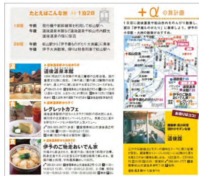
＜乗車後の立ち寄りスポット＞