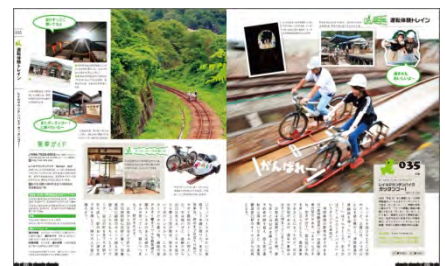
<人力で走る鉄道体験>