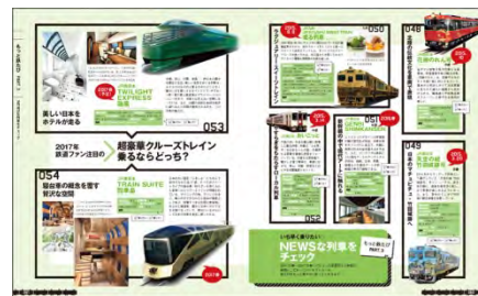
＜これからデビューする新車両＞