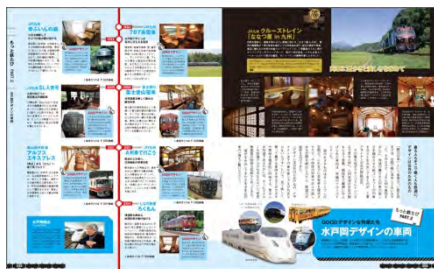
＜水戸岡デザインに注目＞