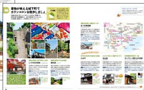
<カランコロンお散歩しましょ>