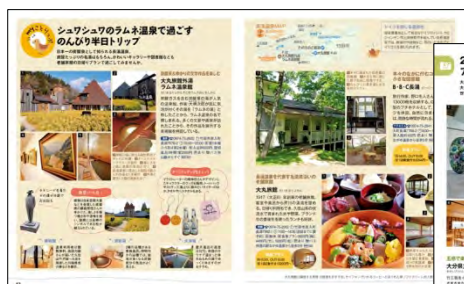
<シュワシュワのラムネ温泉>