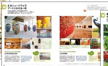
<アートにひたる一日>