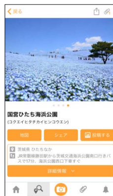
<「国営ひたち海浜公園」 スポットページ>