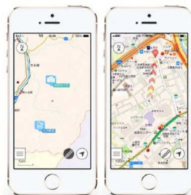
＜スマホでも見やすく＞

（※2）車でのルート検索用データは、2015年9月末時点で判明した2016年4月1日現在の情報です。