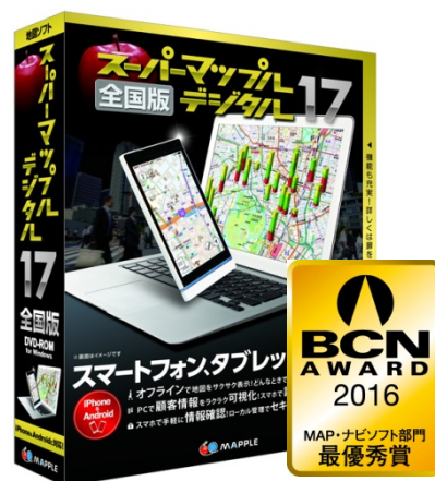
＜スーパーマップル・デジタル17＞

顧客情報や売上情報などを地図上にグラフ表示することでデータを可視化し、マーケティングに活用できることに加え、GPSログによる行動履歴表示、道路交通規制を考慮した効率良いルート作成など、ビジネスにお役立ていただける機能が詰まっています。また、地図上で編集・保存することができるため、プランニングから思い出の管理まで、レジャーにもご活用いただけます。