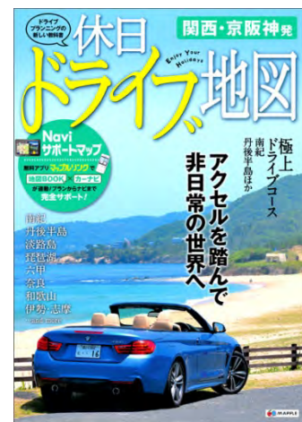
<『休日ドライブ地図』各エリア表紙>

2014年6月に圏央道の相模原愛川IC～高尾山ICが開通、7月には舞鶴若狭自動車道が全線開通し、関東・中部・関西エリアでは、大都市圏から近県エリアへのアクセスがますます便利になってきています。近距離・中距離ドライブが注目を集める今、車のおでかけに役立つ道路地図帳『休日ドライブ地図』を出版いたします。