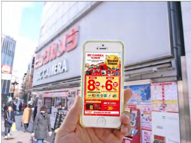
＜人気のビックカメラで利用できるクーポン＞

「DiGJAPAN!」アプリは、今後も訪日外国人観光客に人気のスポットや施設のクーポンを増やしていく予定です。※「ビックカメラ」のクーポンは英語、中国語（繁体字、簡体字）の3言語限定の提供になります。