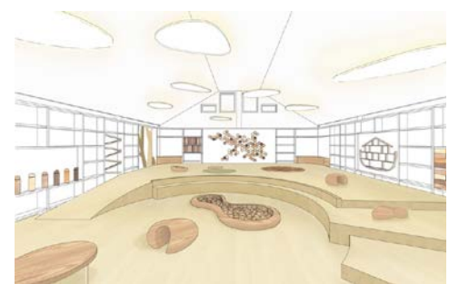
県の木の特徴を活かした遊具がたくさん。