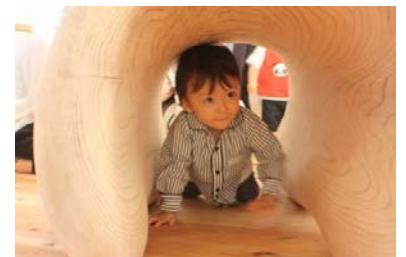
東京おもちゃ美術館でも大人気の木製遊具。