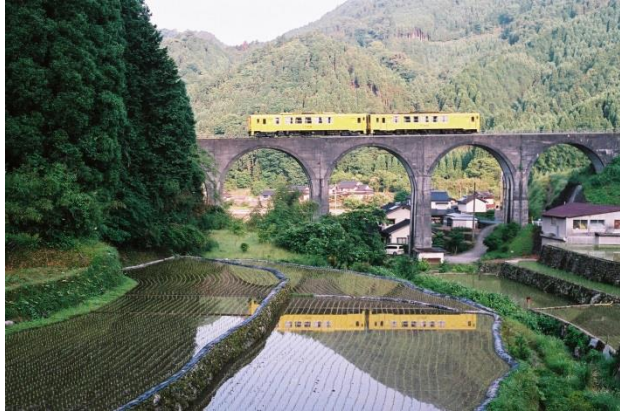
観光名所となっている美しい「めがね橋」