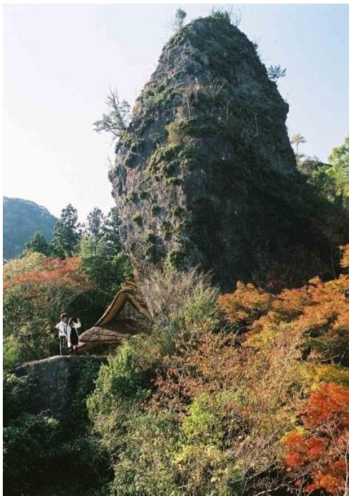
岩屋神社の景観。 大岩は福岡県指定天然記念物