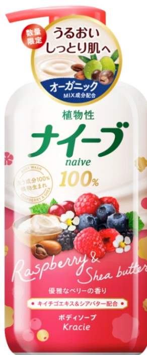
キイチゴ&シアバター