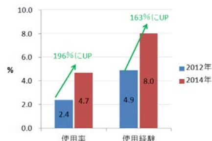
デリケートゾーン用の「ボディウォッシュ」の使用率および使用経験率

「デリケートゾーン用洗剤の使用率」は、2.4%⇒4.7%と、この2年で 96%伸長 しており、 使用率は倍増 しています。さらに、 使用経験率 も、4.9%⇒8.0%と 63%拡大 。特に20代の現在使用率は、3.5%⇒7.5%と 214%と大幅に拡大 しています。