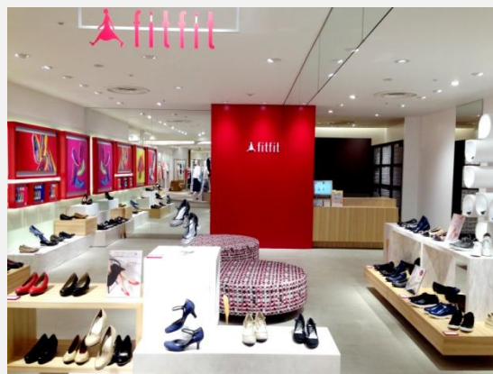
fitfit日比谷シャンテ店 店舗画像