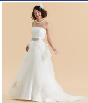
重なり合うチュールから透けて見えるゴールドの刺繍がポイント