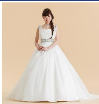
肩のビジュアが可愛いスリーブ付オーバースカート