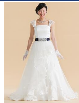
レースとチュールが波打つような曲線がエレガントなオーバースカート