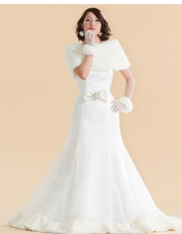
裾に広がるファーがポイントのマーメイド型用オーバースカート