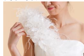
ファーショルダー