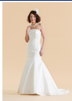
マーメイドライン