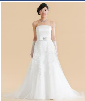
ウエストから裾にかけて大胆にコードレースを使用