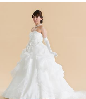
3段に重なるタックがポイントのボリュームあるオーバースカート