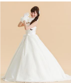
ウエストにさりげないリボンがあしらわれているファーのオーバースカート