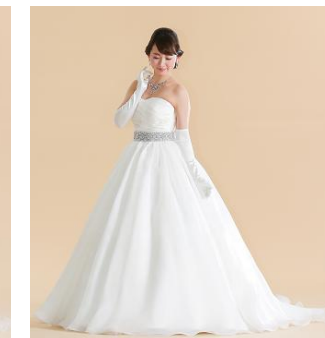
からやかなオーガンジーをふんだんに使用したオーバースカート