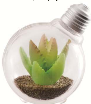
▲アロエブレビフォリア