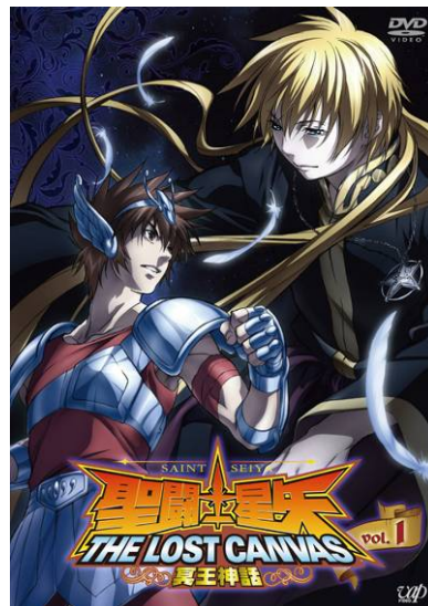
▲Vol.1 DVD ジャケット