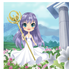
▲アバター例 上:テンマ、下:アテナ