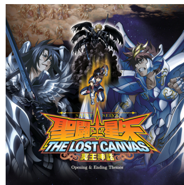
▲ CD ジャケット

巨匠“車田正美”が自ら作詞を手掛けた「花の鎖」、伝説のバンド“EUROX”が書き下ろした渾身の「The Realm of Athena」、カラオケとフルバージョンも収録した聴き応えのある主題歌集！