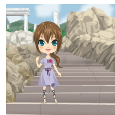
▲アバター例 上:アルバフィカ 下:アガシャ