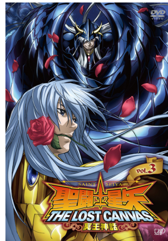
▲ Vol.3 DVD ジャケット