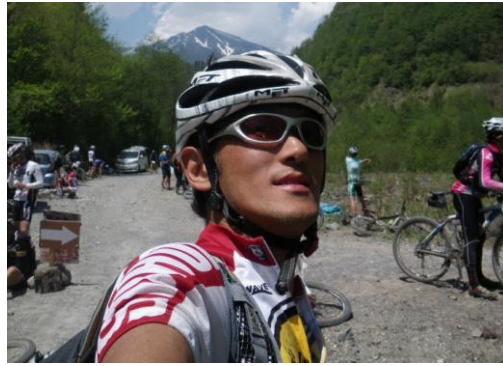
<渡辺航 漫画家『弱虫ペダル』>