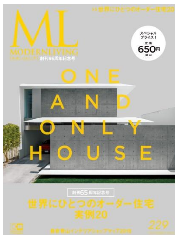
『モダンリビング』229号 310ページ、特別定価650円(税込)

株式会社ハースト婦人画報社(本社:東京都港区、代表取締役社長&CEO:イヴ・ブゴン)が発行するラグジュアリー住宅誌『モダンリビング』は、創刊 65 周年を迎え、その記念号を 2016 年 10 月 7 日(金)に特別定価 650 円にて販売します(販売は株式会社講談社)。