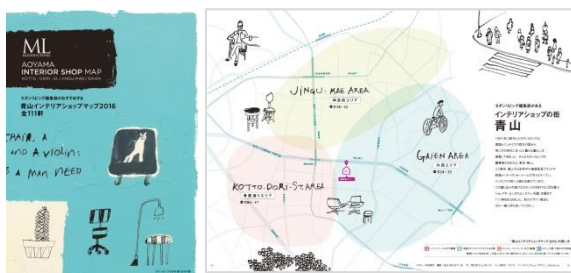
「青山インテリアショップマップ 2016」

『モダンリビング』は、戦後間もない 1951 年に「新しい生活を創る新しい住居の雑誌」として創刊しました。以来、時代に即した日本の住宅、日本人のライフスタイルを提案し続けてきました。創刊 65 周年を記念する『モダンリビング』229 号では、「世界にひとつのオーダー住宅」を特集し、公園の大きな樹木と共存する都心住宅や、エネルギーを自給自足するスタイリッシュな家など、これからの住宅のあり方、暮らし方を見据えたオリジナリティのある住宅を 20 軒、105 ページにわたり美しいビジュアルと丁寧な取材記事で紹介します。