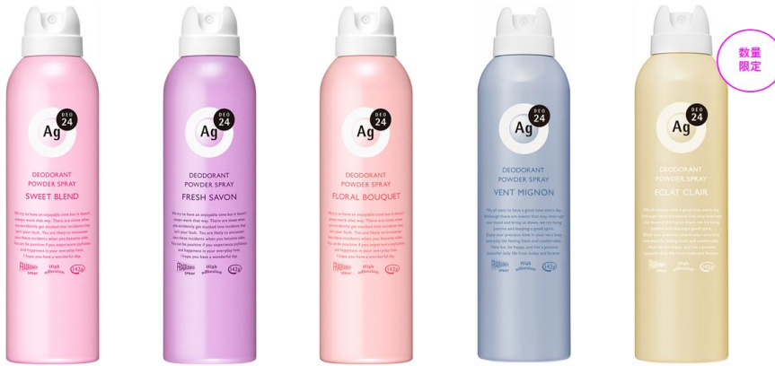
スウィートブレンド フレッシュサボン フローラルブーケ ヴァンミニョン エクラクレール

みずみずしいシトラスが香るティーノートを中心に、シュワッと弾けるジンジャー感をプラス。ふくよかなホワイトフローラルが全体のボリュームをアップさせ、爽やかでほんのりと優しい残香へ。