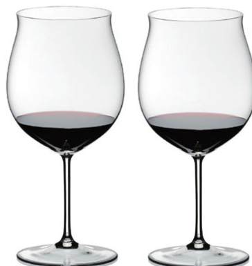
2400/16 BURGUNDY GRAND CRU PAIR