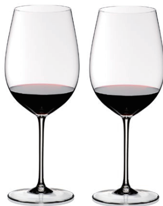
2400/00 BORDEAUX GRAND CRU PAIR

CELEBRATING THE 40 YEAR ANNIVERSARY OF sommeliers