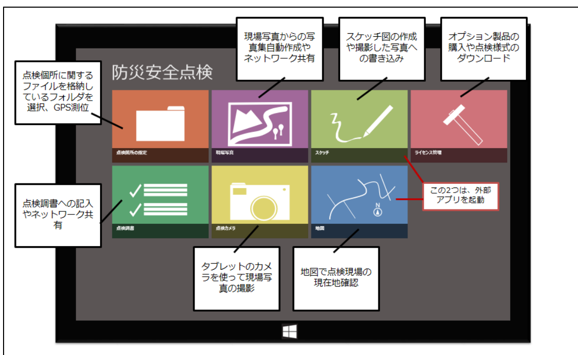
図 2 アプリトップ画面 全体機能構成